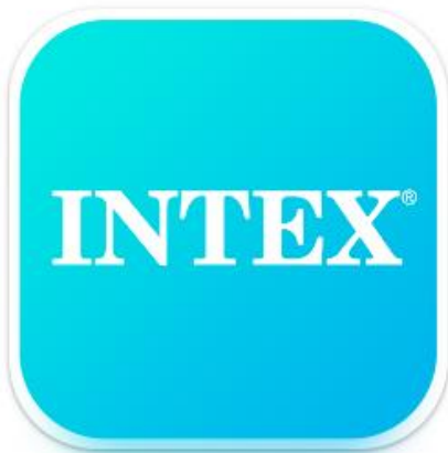
Senoji programėlės piktograma

Svarbu, kad prijungus masažinį baseiną prie WiFi, skydelis būtų pilnai įkrautas ir nuo jo nuimta apsauginė plėvelė.