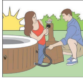
Örnek: Sabahları Spa küveti doğru şekilde şişirilir.