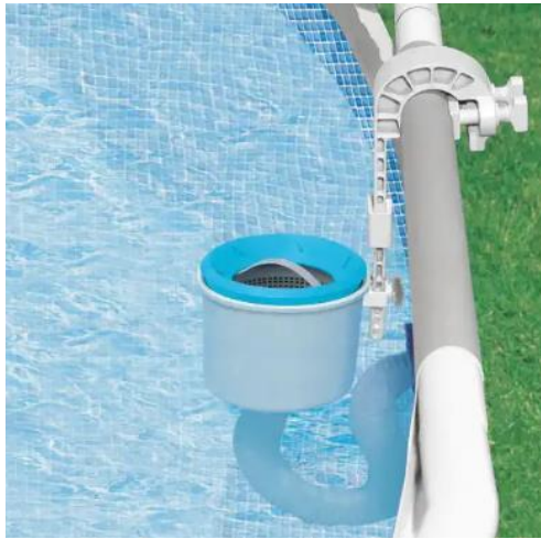
Ilustrační foto. Může se lišit od skutečnosti.