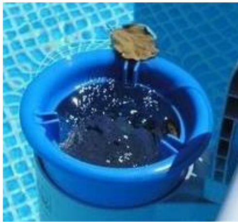
Ενδεικτική φωτογραφία. Μπορεί να διαφέρει από την πραγματικότητα.

Το ξαφριστήρι χρησιμεύει για τη σύλληψη στερεών μηχανικών σκουπιδιών από την επιφάνεια του νερού της πισίνας.