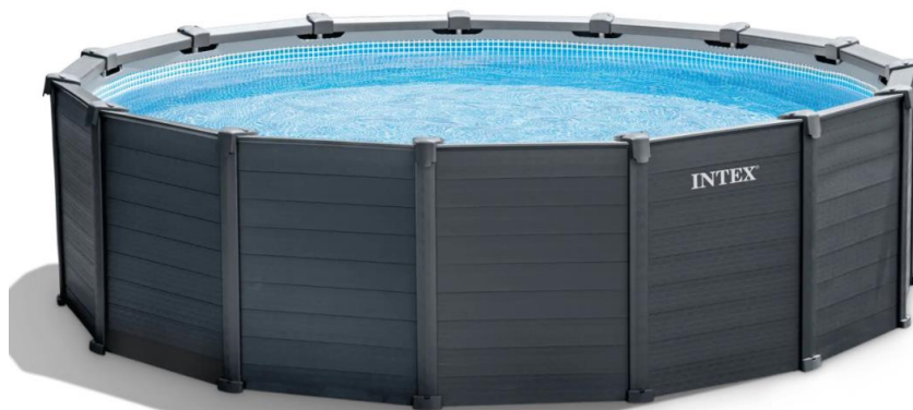
Ενδεικτική φωτογραφία της πισίνας Graphite.