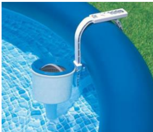
Ilustrativna fotografija. U stvarnosti se može razlikovati.